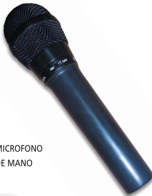
→ MICROFONO DE MANO

El AV 89 B cuenta con una extendida respuesta en frecuencias que permite excelente inteligibilidad para la locución.